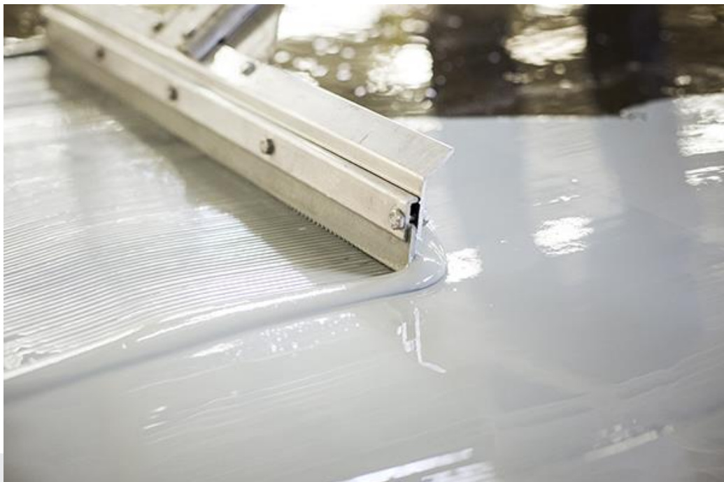
Foto: Aanbrengen vloeistofdicht beschermstelsel.

Voor een certificatie-instelling is protocol 7704 het uitgangspunt voor het uitvoeren van onderzoek naar en controles op de werkwijze van de aannemer bij het uitvoeren van de beschreven werkzaamheden.